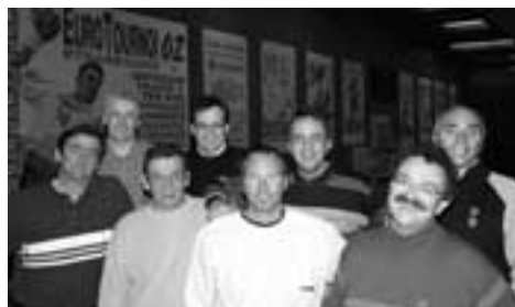
Les membres fondateurs de l'ET, réunis dix ans après.

Sous ces bougies, il y a bien évidemment un biscuit, et sur ce gâteau il ne pouvait y avoir plus belle cerise que cette nouvelle salle, ce Rhénus Sport, que la ville met à la disposition de notre tournoi. Longtemps assimilée à une Arlésienne dont on parlait plus qu'on ne la voyait, cette salle de sport digne de notre ville a enfin vu le jour cette année, promesse tenue !. Par sa capacité proche de cinq fois celle des salles fréquentées jusqu'à lors, elle nous offre le pari de réunir à terme tout le monde du handball et des passionnés de sport dans des conditions optimales de confort. Il va nous falloir apprivoiser ce volume tout en préservant les relations proches et amicales qu'on su établir le public et les équipes invitées.