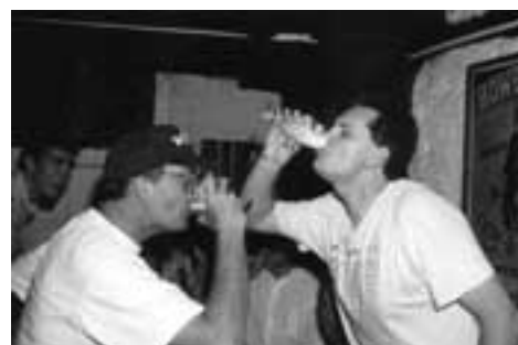
La grande époque où des compétitions parallèles à l'ET étaient organisées...

C'est dans cet esprit que s'est à nouveau construit le plateau sportif de cette année. La qualité est incontestablement au rendez-vous. Si il y a 10 ans, pour la première édition, le vainqueur s'appelait Montpellier et remportait dans la foulée son premier titre de champion de France, c'est en grand d'Europe, le meilleur club de notre vieux continent, que nous recevront cette année le même Montpellier. Comble de l'émotion et de la fierté pour les strasbourgeois en