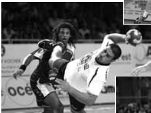
Les matchs d'hier