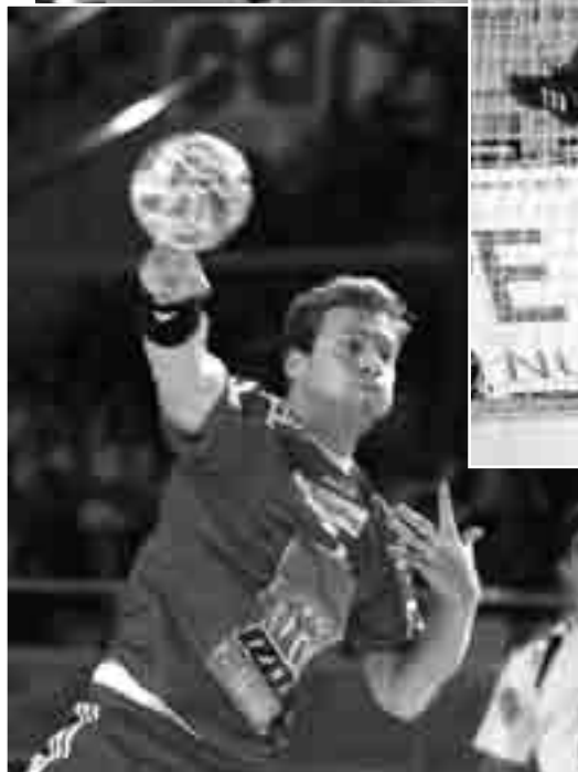
Les matchs d'hier