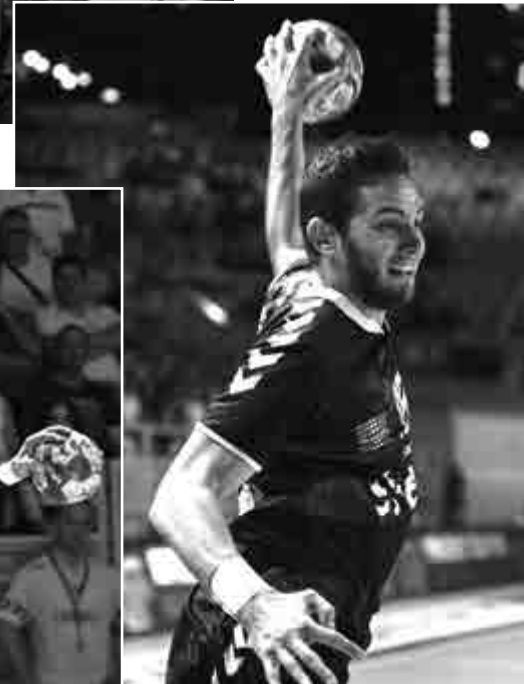
Les matchs d'hier