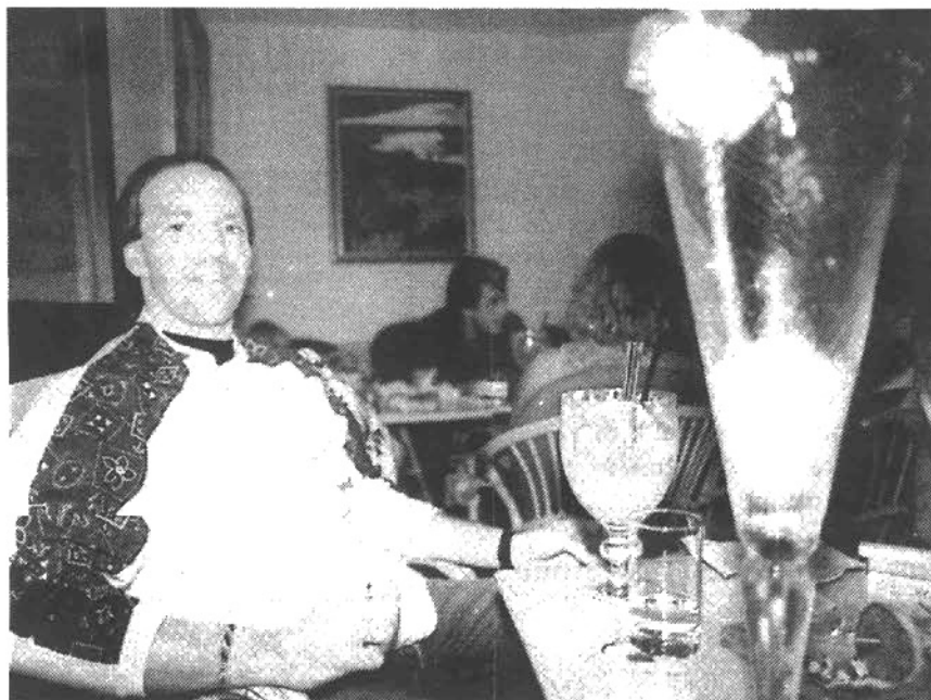
"Grodjack" tel qu'en lui même !

Je conçois également mon rôle comme celui d'un animateur hors des matches, car être capitaine est aussi une façon de vivre sa relation avec les joueurs, l'entraîneur et les dirigeants car je ne veux pas être accepté uniquement comme handballeur, mais l'être avant tout comme homme.