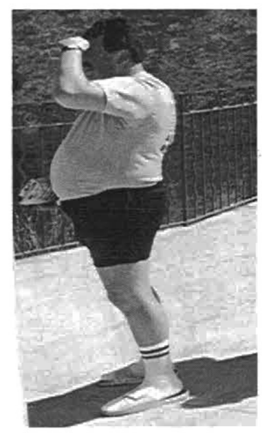
DANS LE PANNEAU !