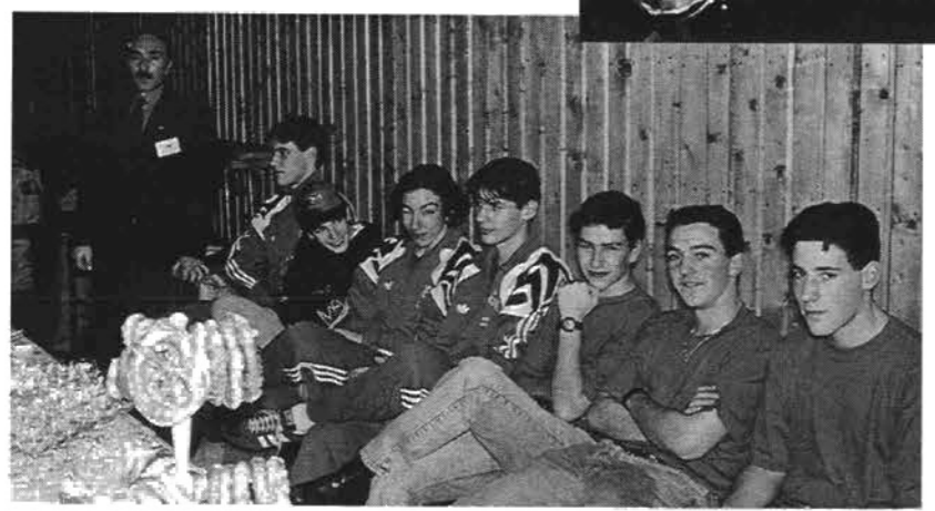
Les jeunes toujours prêts à donner un coup de main