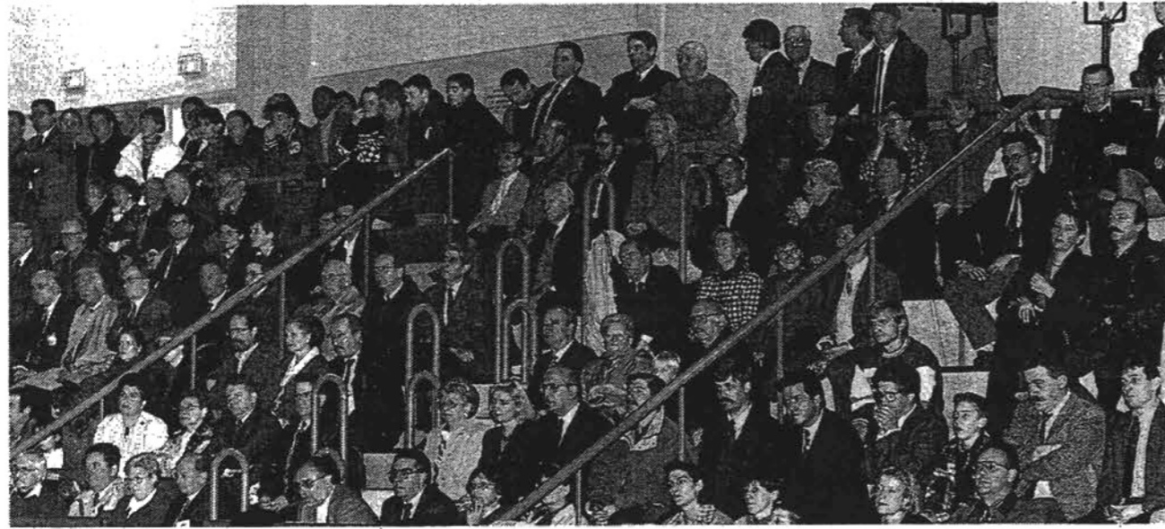
L'ASL Robertsau: une grande famille où les membres méritants ne manquent pas.