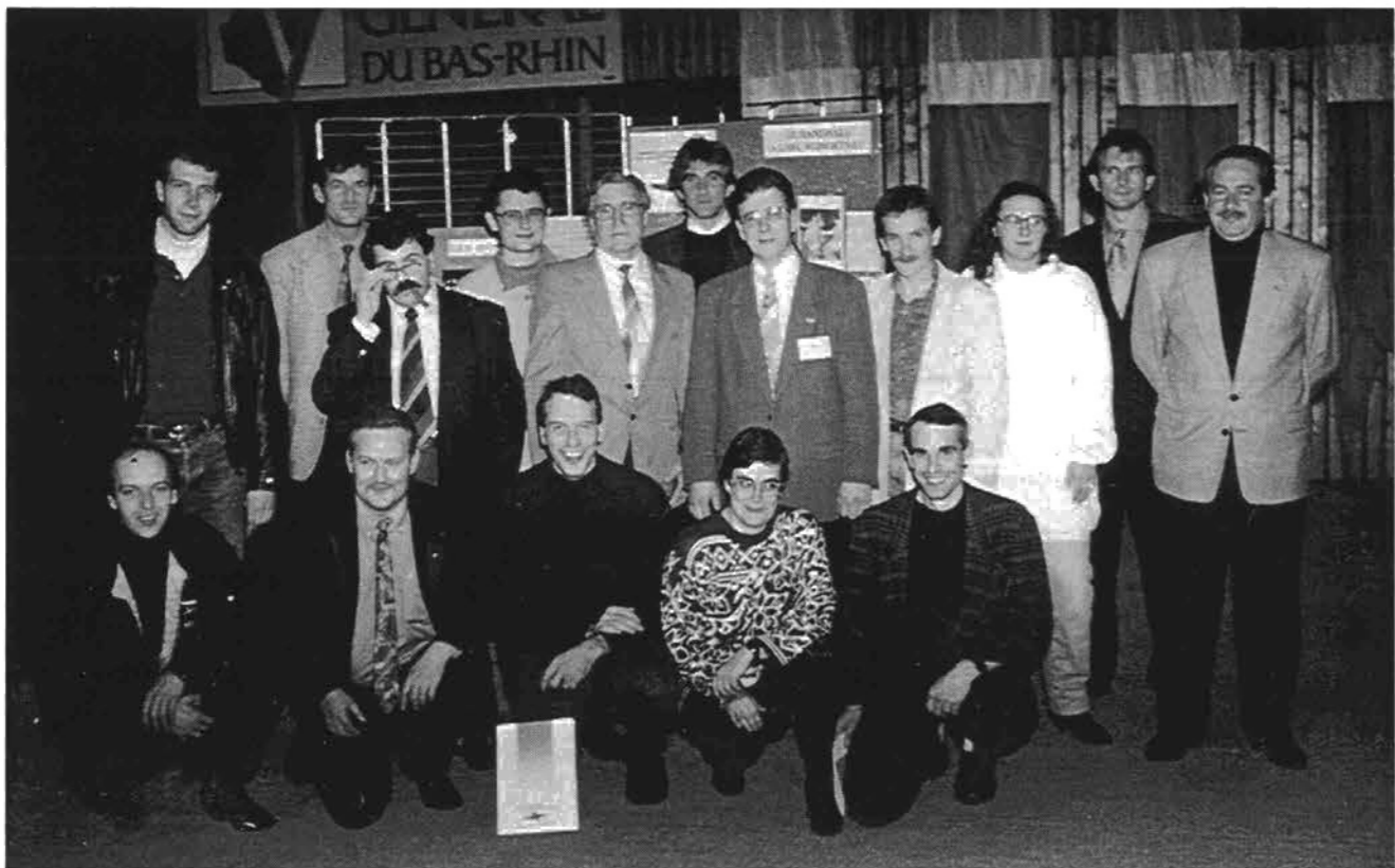
Les membres de la section Handball honorés au cours de la soirée