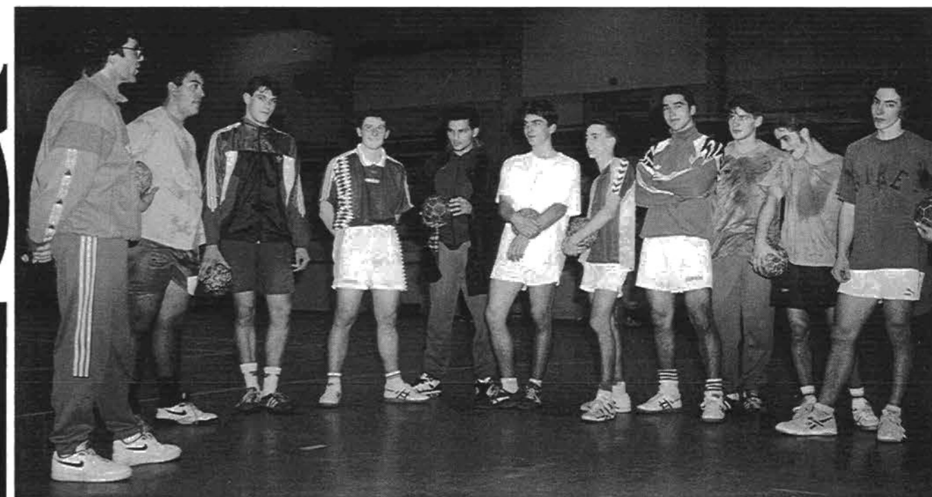
A l'écoute ...la voix de son coach

Ce groupe est animé par des individualités attachantes, poètes, tantôt anges tantôt démons ces joueurs restent attachants et appliqués, bien que parfois capricieux.