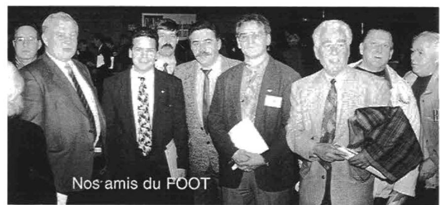
Nos amis du FOOT