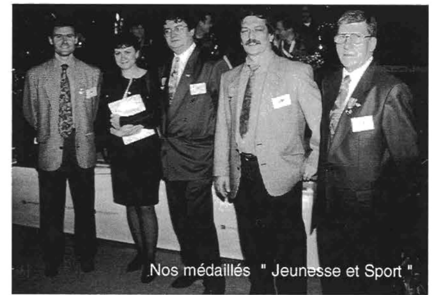
Nos médaillés " Jeunesse et Sport "