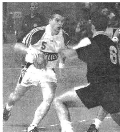
Les frères Gille (Guillaume à gauche et Bertrand) et l'équipe de France ne feront pas étape en Alsace en 2001. Ainsi en a décidé la FFHB.